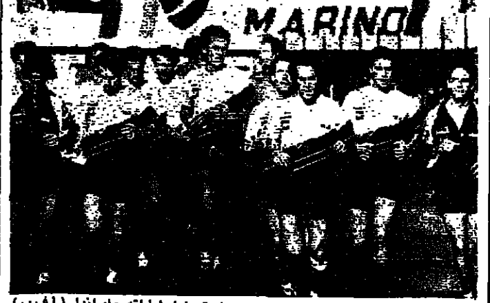
الفرق الايطالي يتربى استعدادا لمراته وايراندا (العب)